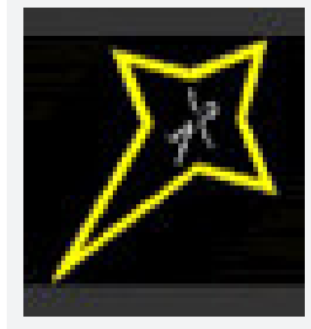
Figura 3. Campaña estrellas negras. (Ver anexo).

El servicio de emergencias médicas (en nuestro medio, el centro regulador de urgencias -CRU-) y el profesional de la salud, quienes componen la asistencia sanitaria, deben asesorar al estamento gubernamental para actuar de manera proactiva, es decir, determinando la forma de alterar favorablemente al huésped, al agente y al ambiente para prevenir las lesiones; deben intervenir con campañas preventivas, continuas y dinámicas que lleguen directamente a los indi-