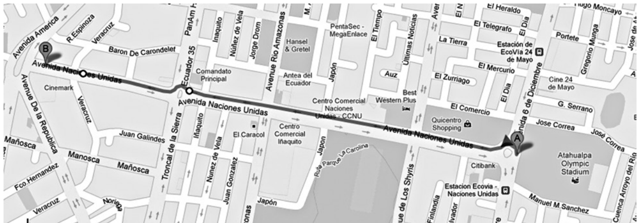
FIGURA 1.. Recorte Avenida Naciones Unidas (A-B), Quito.

La investigación de este estudio de caso se realizó entre julio y septiembre de 2012, cuando recién se había terminado un tercio de todo el Boulevard, el tramo entre la Avenida Los Shyris y la Calle Japón. Para reflejar las consecuencias de esta intervención urbana sobre la configuración del espacio público, el abordaje del caso se enfoca en los vendedores ambulantes que trabajaban allí mismo. Por medio de entrevistas semiestructuradas con siete vendedores, se buscaba comprender el modo en que ellos han sido afectados por la construcción del Boulevard. De esta manera, el estudio de caso analiza la situación de los vendedores, como una ilustración de cuáles son los actores que efectivamente tienen derecho a la ciudad y cuál es el grado real de inclusión, que espera el municipio alcanzar con tal intervención.