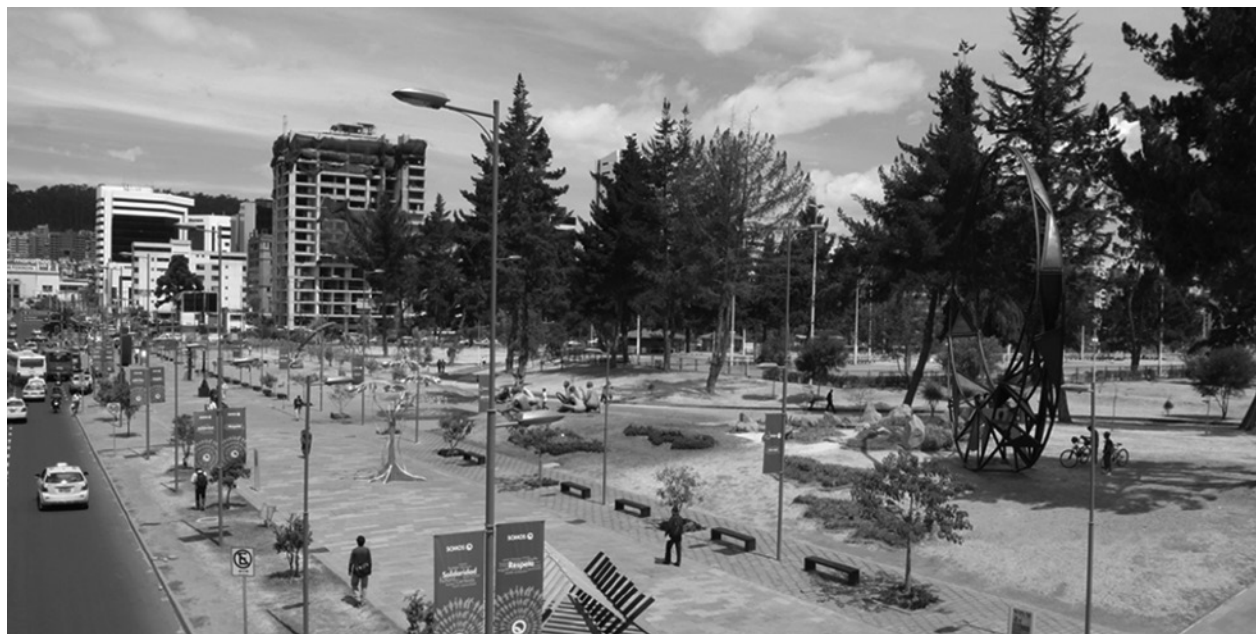
FIGURA 3. Boulevard Naciones Unidas, Parte Sur / Parque La Carolina. Fuente: elaboración propia, 16.09.2012.