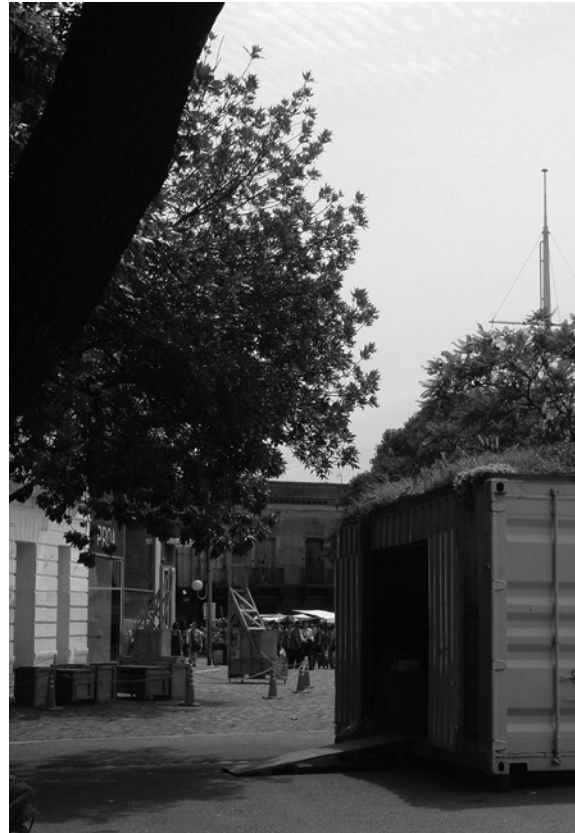
FIGURA 6. Paseo de Vuelta de Rocha, La Boca.

Estos lineamientos, han significado una configuración determinada de los espacios públicos en la zona sur de la Ciudad de Buenos Aires y La Boca en particular. En este punto, encontrándonos a más de una década de la implementación de las políticas descritas, el siguiente apartado se propone analizar las implicancias de este proceso, en la producción de un tipo determinado de espacios públicos, focalizando en la Calle Museo Caminito (figura 4; punto C y figura 5), y la ribera inmediata del Paseo de Vuelta de Rocha (figura 4, punto A-B; y figura 6), del barrio la Boca.