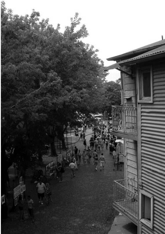
FIGURA 5. Calle Museo Caminito, La Boca.