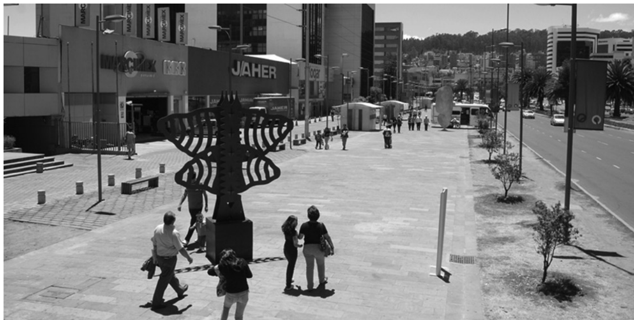
FIGURA 2. Boulevard Naciones Unidas, Parte Norte (al fondo las casetas de venta).