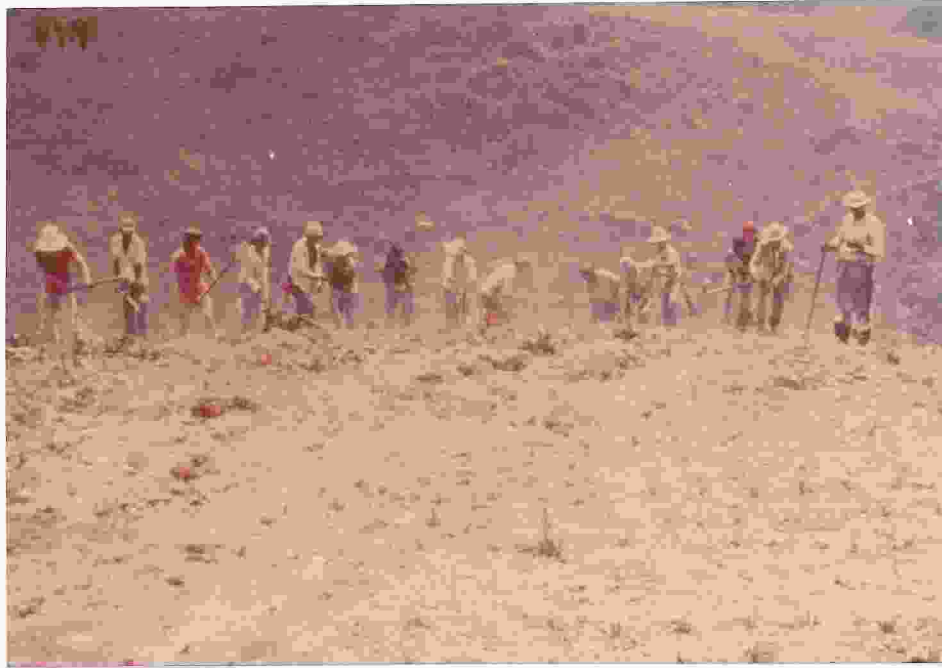
Figura 7. Las comunidades de trabajo son consecuencia del trabajo con grupos.