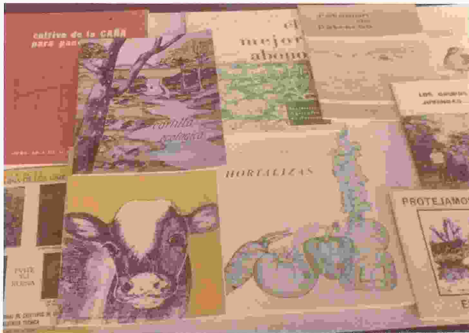
Figura 9. Los Folletos (Método escrito), puede llegar a un buen número de gente, pero requiere una previa preparación de los usuarios y son sólo un suplemento de otros métodos.