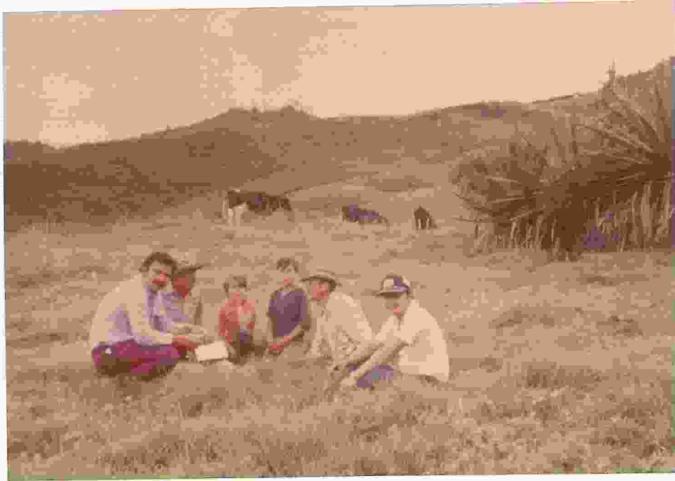
Figura 6. El contacto con grupos ayuda a la posterior conformación de comunidades de trabajo.