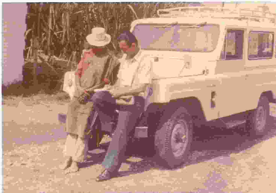
Figura 5. El método de contacto individual tiene un costo alto, pero crea confianza en el usuario ; sirve para ganarse la confianza de los líderes .