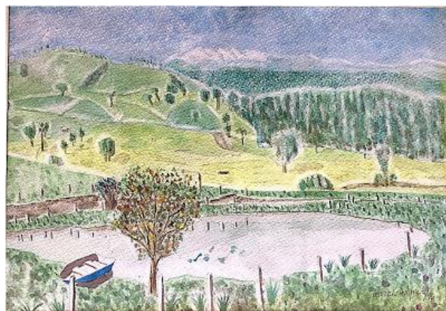
Imagen: El Porvenir; Acuarela de Gonzalo Duque-Escobar