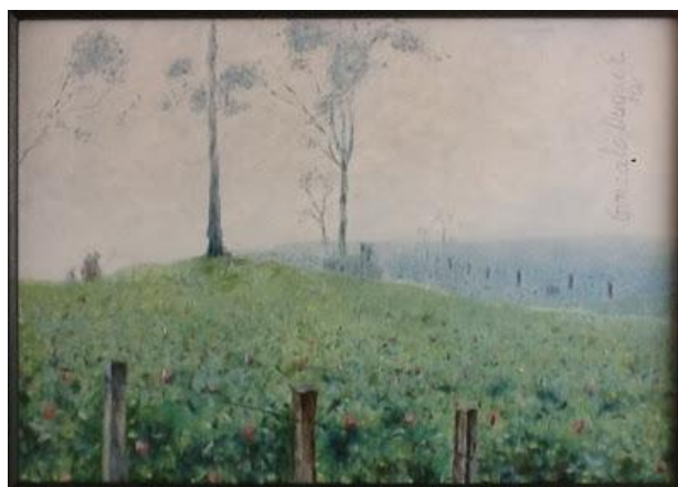
Imagen: Papal en Murillo; Óleo de Gonzalo Duque-Escobar

. Agua como bien público. Duque Escobar, Gonzalo (2017) In: Semana ambiental. Junio de 2017. Corpocaldas, Aguas de Manizales y Alcaldía de Manizales. Teatro Fundadores, Junio 9 de 2017. Manizales.