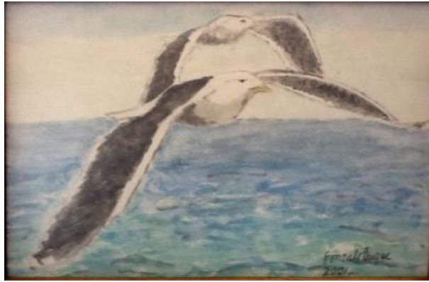
Gaviotas; Acuarela de Gonzalo Duque-Escobar

. . Agua para todos: el desastre del río Mira. Duque Escobar, Gonzalo (2009) Boletín ambiental del IDEA. U.N. de Colombia