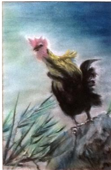
Imagen: Canto de alborada; Pastel de Gonzalo Duque-Escobar

Albert Einstein. Duque Escobar, Gonzalo (2016) In: Apertura del Contexto en Astronomía, Febrero 1 de 2016, Universidad Nacional de Colombia, Sede Manizales. U.N. de Colombia. Manizales.