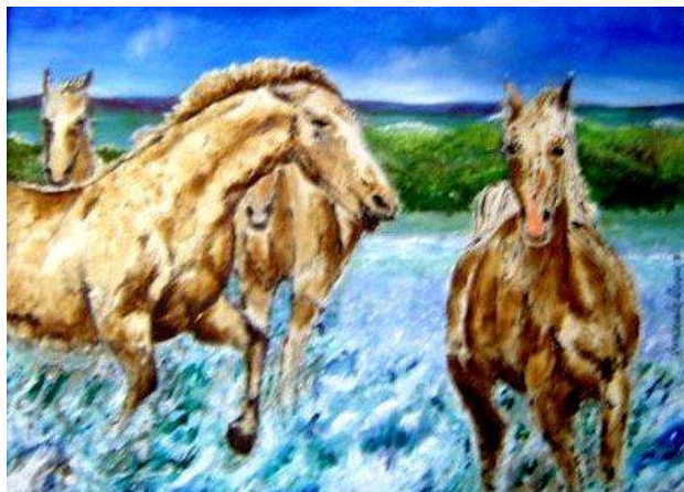
Imagen: Caballería ligera; Óleo de Gonzalo Duque-Escobar

Aspectos geofísicos de los Andes de Colombia. Duque Escobar, Gonzalo (2009) (Workshop Item). In: 1er Congreso Internacional de Desempeño Humano en Altura, Noviembre 19 de 2009, Manizales.