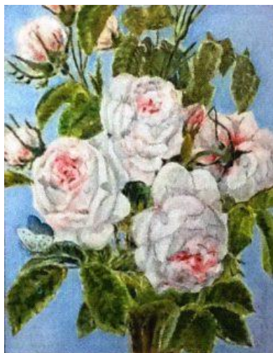
Imagen: Rosas; Óleo de Gonzalo Duque-Escobar