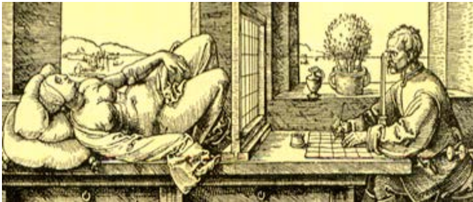
“El Portillo” Alberto Durero 1525

El globo es una reducción del cuerpo de la tierra. Necesidad de aplanar la tierra. Necesidad de representarla objetivamente. Necesidad de medir sus distancias, necesidad de precisarla y cuantificarla, como lo expresa bella y proféticamente Alberto Durero en su grabado “El Portillo” realizado en 1525.