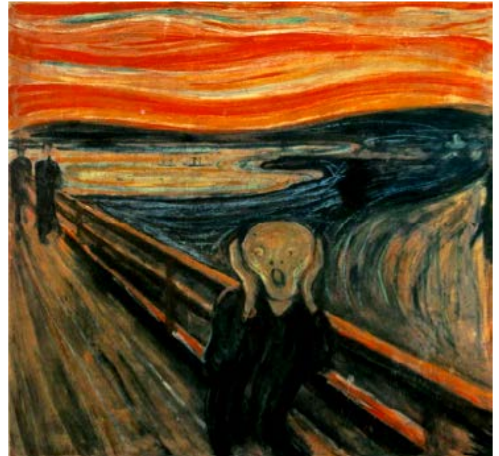
"El Grito" Edvard Munch 1893

mitos fundantes; tal ha sido la condición de orfandad de nuestra cultura; condición que nos ha sumido en la desolación propia de quienes lo han perdido todo; sin casa y sin cuerpo; sin mitos, sin padre y sin madre... ¿qué nos queda?