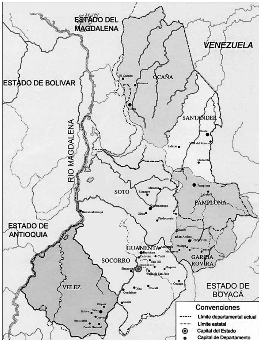
Figura 1. Mapa de las provincias del Estado de Santander