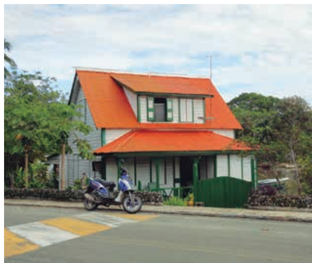
Figura 2. Casa estilo bungalow machihembrada en el icónico sector de El Cove.

productos traídos por las goletas que se llevaban el coco. Y aludimos al paisaje laboral, porque la disminución del esfuerzo para recolectar el coco, comparado con el trabajo que requería el algodón, en términos de horas de trabajo, permitía extensiones de tierra de percepción utilitaria más grandes y más densamente cultivadas con palmas, dada la conveniencia en aumento de su precio de exportación. Paisajes además enriquecidos por un mar que acercaba más la isla a los Estados Unidos y por los estadounidenses que, traídos por este, desplegaban sus costumbres, formas de habitación y actividades a la isla (Parsons [1956] 1985). A todo esto, súmese una transformación paisajística fundamental en el contacto social, dada por el paso de las propiedades circunscritas y con viviendas aisladas entre sí de las plantaciones al patrón de habitación de los nuevos propietarios, a lado y lado de los caminos que recorren la isla y que permite mayor interacción de la comunidad, mayor flujo de información y mejor conectividad (Parsons [1956] 1985). Así mismo, viviendas de madera machihembrada estilo cabaña o bungalow , de uno o dos pisos, con sus respectivas cisternas y conscientes de los vientos y mareas, fueron el elemento arquitectónico en auge del cambiante paisaje (figura 2).