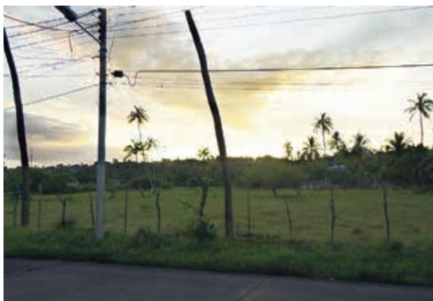
Figura 1. Ejemplo de paisaje laboral o taskscape en San Andrés, adyacente al sector de La Loma o The Hill. Fotografía de Camilo Soler, octubre 2011.

(en palabras del mismo Ingold 2000) si se lo considera como trabajo, en términos de horas/hombre-mujer. Sin embargo, para el presente estudio es fundamental enfatizar en la dimensión cualitativa y variable de esta acción, llamada en adelante “labor” (es decir task , según Ingold 2000, 195). Estas labores son acciones con el propósito humano de habitar el paisaje y se destacan por no existir ni estar aisladas de otras labores, ni limitadas a un solo ser humano. En otras palabras, las labores humanas sobre el paisaje son siempre sociales y parten de un proceso. Al conjunto de labores que ejerce un grupo humano sobre un paisaje en particular se le denomina “paisaje laboral” o taskscape . De esta forma, el paisaje de Ingold refiere más a la percepción cognitiva propuesta por Korff (2005), mientras que el paisaje laboral apunta más a su definición de percepción utilitaria, al tiempo que la emocional parece estar ligada por igual al paisaje y al paisaje laboral. Un ejemplo de dicha interacción entre paisaje y paisaje laboral se presenta en la figura 1, donde el paisaje de una planicie al pie de The Hill, la cima más alta de San Andrés, posee una connotación de paisaje laboral como tierra de pastoreo de reses, pero en el pasado solía ser un paisaje laboral del cultivo de coco, y, por tanto, la percepción emocional de este terreno, en particular, para quienes vivieron el auge del coco, sigue siendo el de una campo de cocos.