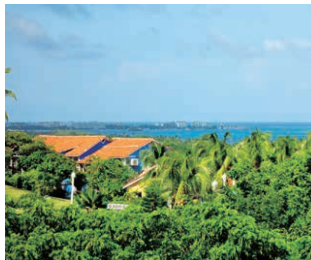
Figura 3. Vista desde Harmony Hill, yuxtaposición de paisajes. Fotografía de Camilo Soler, noviembre 2011.

de lujo en los hoteles de gran tamaño del centro y la barrera de coral, punto clave del pasaje laboral tradicional de los pescadores locales.