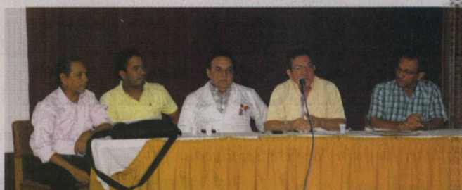
■ A la asamblea de docentes asistieron muchos de los profesores de la Universidad de Cartagena, quienes hicieron llamado a los egresados de la institución a que se una a la protesta.

En la Asamblea, los docentes coincidieron en realizar campa-